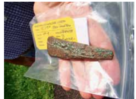
Der älteste Metallfund der Schweiz: Die Klinge eines Metallbeils.