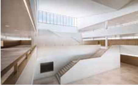
Viel Licht im Atrium dank Fenstern im Dachaufbau.

senhaut (Vorverglasung). Der Sonnenschutz ist in den Fassadenelementen integriert und somit vor Witterungseinflüssen geschützt und auch bei starken Winden jederzeit verfügbar. Dieser erfolgt in einzelnen Fassadenelementen durch das einlamierte Gewebe und in den anderen Elementen durch die eingebauten, elektrisch gesteuerten Sonnenstoren. Pro Schulzimmer sind 2 bis 3 Lüftungsflügel vorhanden. Nach Beurteilung der Vogelwarte Sempach werden auch die Anforderungen an die Fassade bezüglich Vogelschutz erfüllt. Der Unterhalts- und Reinigungsaufwand ist wesentlich geringer als bei konventionellen Fassadensystemen.