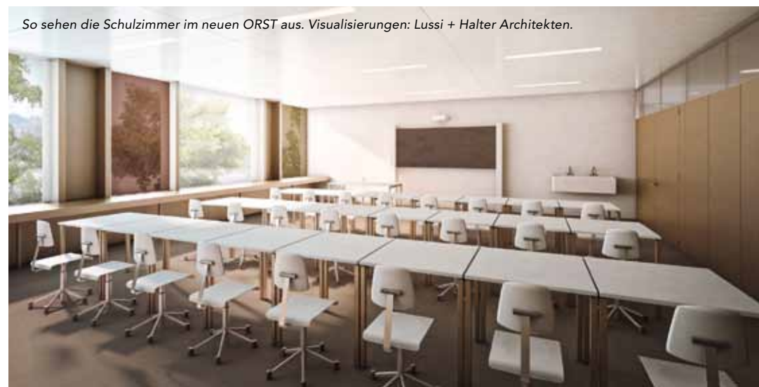
So sehen die Schulzimmer im neuen ORST aus. Visualisierungen: Lussi + Halter Architekten.