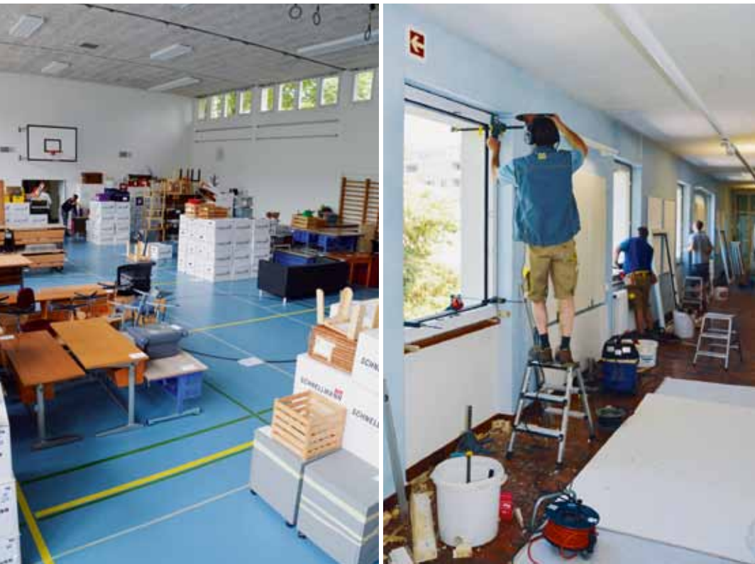
Während den Sommerferien wurde das Allmendschulhaus umgebaut. Nun ist es bereit für die neuen IF-Klassen. In der Turnhalle wurde das Material der Schulzimmer zwischengelagert.

Die entdeckten offenen Fragen werden angegangen, so dass der Prozess, hin zur integrativen Schule, konstruktiv weitergeführt werden kann.