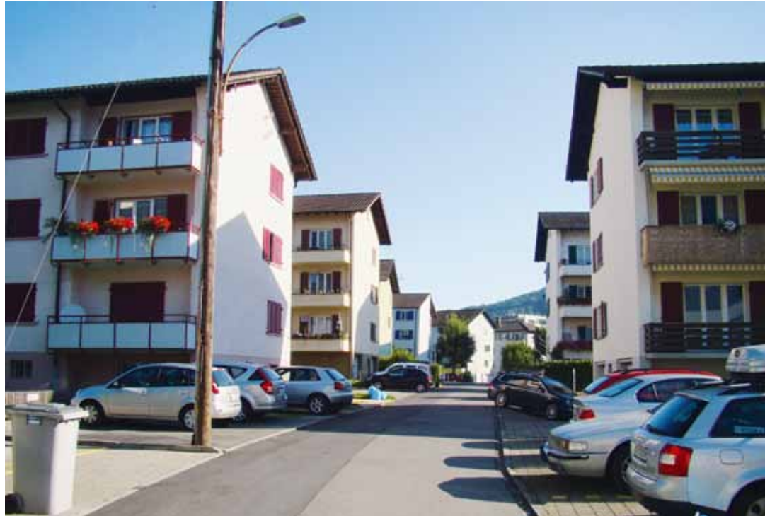
Das Riedmatt-Quartier wurde in den 1950er- und 1960er-Jahren erbaut.

Mit dem Wachstum des Individualverkehrs verlor das Quartier, aufgrund einer schleichenden Zunahme von Aussenparkplätzen,