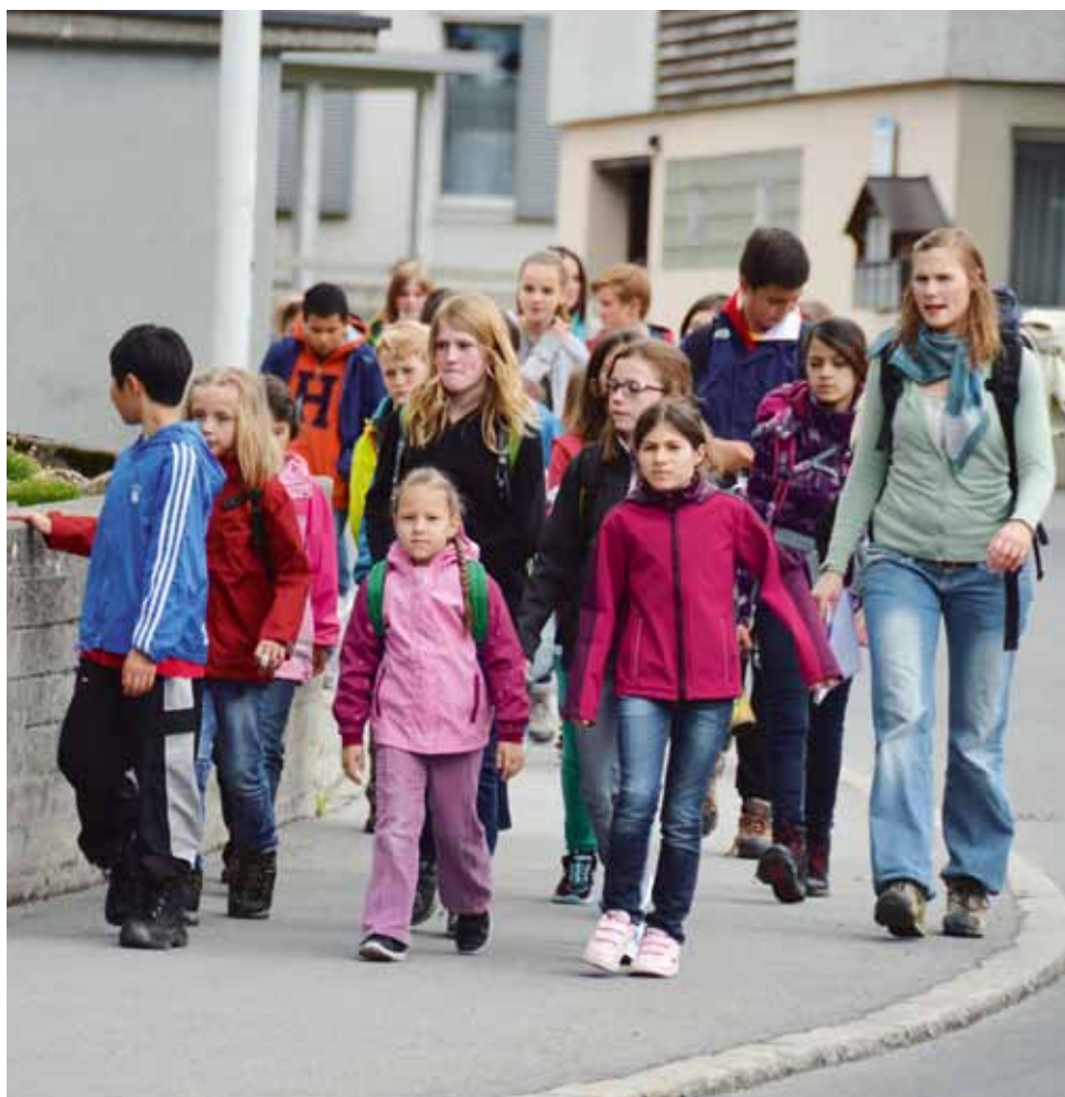
Zum 40-Jahr-Jubiläum waren die Schulkinder des Spitz eine Woche in Engelberg. Siehe Seite 17.