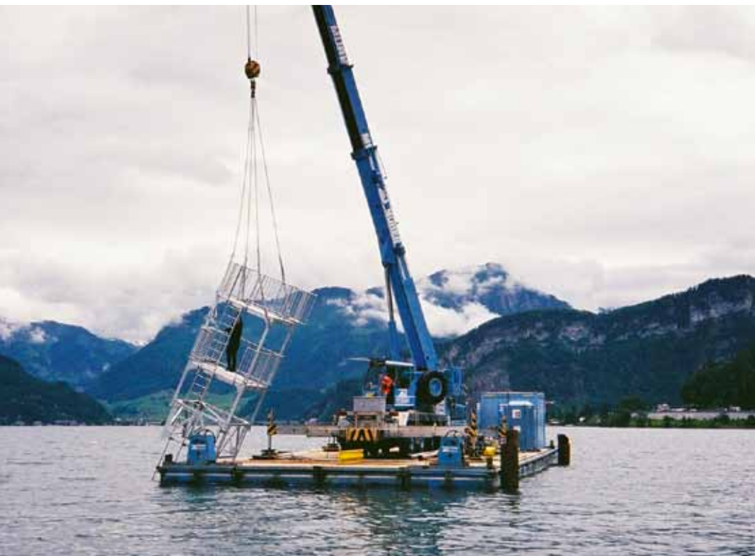
Der Sprungturm wurde revidiert und ist nun wieder offen.

Zur Freude aller Badegäste, besonders aber für die Jugendlichen, steht im Seebad Horw der Sprungturm und das Floss frisch saniert zur Verfügung. Der Sprungturm wurde den neusten Sicherheitsvorschriften angepasst.