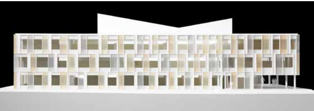
Modell des neuen Oberstufenschulhauses: Zu sehen in der Ausstellung ab Mitte Oktober.

Das Oberstufenschulhaus in Horw soll ab Sommer 2015 saniert und erweitert werden. Der Gemeinderat beantragt beim Parlament einen Kredit in der Höhe von 29,77 Millionen Franken. Nach dem Alters- und Pflegeheim vor 12 Jahren, tätigt die Gemeinde mit dem Oberstufenschulhaus nun eine ihrer grössten Investitionen für die Jugend. Das markante Gebäude mit einer farbenfrohen Fassade wird trotz grösserem Volumen nur noch \frac{1}{3} der heutigen Energie verbrauchen.