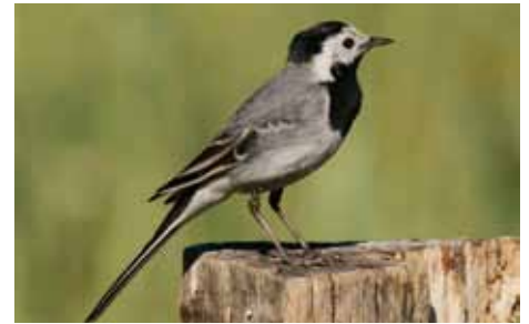
Die Bachstelze gewöhnt sich an eine laute Umgebung.

Die Bachstelze ist ein zutraulicher Vogel. Oft findet man sie in der Nähe von Gewässern, aber sie ist nicht an sie gebunden, obwohl man das durch das «Bach» in ihrem Namen annehmen könnte. Sie bewohnt sowohl Fluss- und Seeufer, Acker, Weideland, Wiesen, Brachen und Rasenflächen aber als Kulturfolgerin auch gerne das Siedlungsgebiet. Dort nutzt sie das dicht bebaute Gebiet.