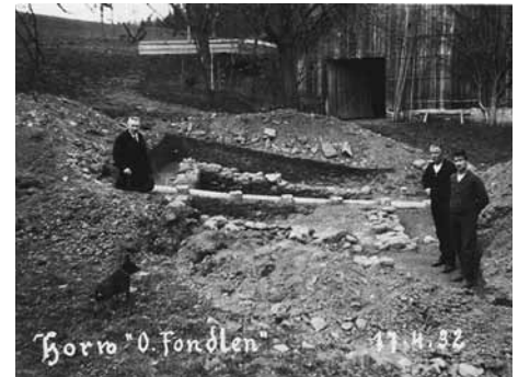
1932 wurden bei Grabungen weitere archäologische Funde gemacht.

in einem Kantonsarchiv, bis sie vor wenigen Wochen von Archäologe Ebbe Nielsen genauer untersucht wurde. «Die Klinge ist mehr als 6000 Jahre alt und stammt vermutlich aus einer Mine aus den Ostalpen.» Damals seien die Menschen in Horw in der Landwirtschaft tätig gewesen, es habe aber bereits einen regen Handel gegeben. «Die Metallbearbeitung ist eine der grossen kulturellen Leistungen der Steinzeit. Hier hat die Entwicklung begonnen, die direkt zur Industrialisierung und zur modernen Gesellschaft führte», meint Nielsen. Als Buholzers 1929 eine Jaucheleitung verlegen wollten,