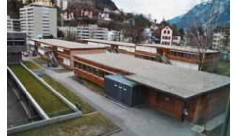
Das Provisorium während des ORST-Umbaus.

Das neue Oberstufenschulhaus ist eines von vier neuen Gebäuden im Horwer Ortskern. Das Projekt «Horw Zentrum Plus» umfasst neben dem Oberstufenschulhaus die Realisierung der drei neuen Bauten «Kopfbau Ost», «Bau Mitte» sowie «Längsbau» an der Allmendstrasse. Im gleichen Zug wird das Gemeindehaus saniert. Diese Vorhaben werden zwischen 2014 bis 2019 realisiert und dem Horwer Ortskern eine unverwechselbare Identität geben. Weiter werden ein neuer Mehrzweckplatz, ein grosszügiger Kinderspielplatz und Veloabstellplätze realisiert sowie eine attraktive Gestaltung der Grünanlagen ausgeführt.