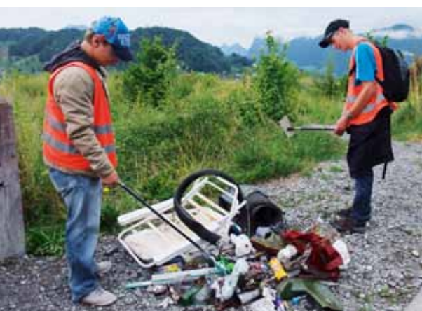
Die Lernenden der Stiftung Brändi machten in Horw sauber und fanden allerlei Kurioses.

Anfang August haben 55 Lernende ihre Ausbildung bei der Stiftung Brändi begonnen. Die Jugendlichen lernten, was «Littering» für die Gemeinde Horw bedeutet und wie Recycling richtig funktioniert. Einen Tag lang sammelten sie auf dem Gemeindegebiet alles ein, was Unbekannte gedankenlos