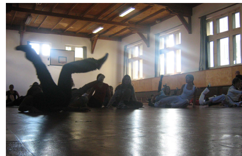
Abb. 8: Selbstverteidigungskurs

Im Frühjahr wurde zum dritten Mal der Selbstverteidigungskurs für Mädchen der Oberstufe angeboten, ein Projekt welches in Zusammenarbeit mit der Schulsozialarbeit und einer externen Fachfrau (Pallas Trainerin) organisiert wird. Der Kurs fand während sechs Kursnachmittagen an zwei Stunden statt und hatte zum Ziel die Selbstwahrnehmung und Selbstsicherheit der Mädchen zu stärken. Während des Kurses lernten diese, wie man sich optimal gegen Belästigungen wehren kann und wie man Gefahren einschätzen lernt. Das Angebot war ausgebucht und die Mädchen erlebten es als Bereicherung.