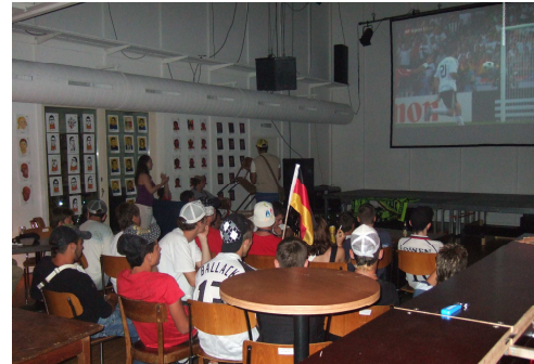
Abb. 7: Publikum im EM-Studio

Während der Europa Meisterschaft 2008 wurde in der Zwischenbühne ein temporäres EM-Studio eingerichtet – ein gemeinsames Projekt mit dem Verein Zwischenbühne. Geplant war, alle Spiele der Schweizer Nationalmannschaft in der Vorrunde auszustrahlen. Da die Nachfrage nach einem EM-Studio ohne Konsumzwang und Eintritt so gross war, zeigte man schliesslich auch die Spiele des Viertel- und Halbfinals und das Final. Für alle Anlässe wurde die Zwischenbühne mit einer Grossleinwand, Barbetrieb und einem Grill im Aussenbereich ausgestattet.