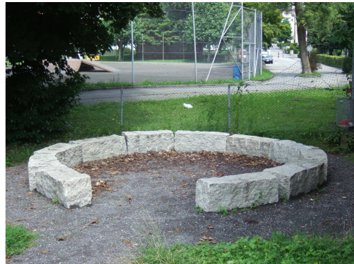
Abb. 1: Steinkreis beim roten Platz

Auch in diesem Jahr traf sich das Netzwerk Jugend an insgesamt fünf Sitzungen. Der Austausch in diesem Gremium war wiederum äusserst fruchtbar. So konnten einige Aktivitäten und Projekte weiterentwickelt und konkretisiert werden. Das Projekt Schulanlagen als Begegnungsraum erhielt zunehmend auch im Sozialraum ein Gesicht. So wurden grosse Regeltafeln für die Benützung der Plätze aufgestellt und ein Platz-Management eingeführt. Die im letzten Jahresbericht schon erwähnte Unterarbeitsgruppe „Schulanlagen als Begegnungsraum“ beobachtet das Geschehen laufend und steht zudem über das BfJ mit den Jugendlichen und den Anwohnerinnen/Anwohnern in regem Kontakt.