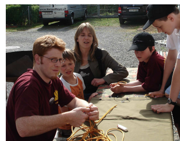
Abb. 10: Jungwacht

Durch die Zusammenarbeit zwischen dem BfJ und der kirchlichen Jugendarbeit können Kräfte gebündelt werden. Die Beziehungsarbeit und das Zugänglichmachen von Raum verfolgen das Ziel, Jugendliche zu selbständigem, engagiertem und verantwortungsbewusstem Handeln zu animieren und damit Lernprozesse im Gesellschaftsleben anzustossen. Denn sowohl die Politische Gemeinde wie auch die Kirchgemeinde sind darauf angewiesen, auch in Zukunft verantwortungsbewusste BürgerInnen in unserer Gesellschaft zu haben.