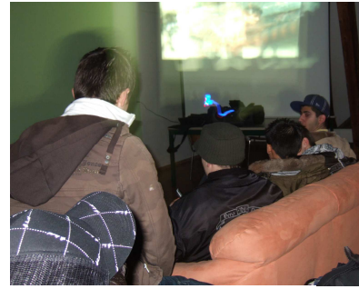
Abb. 9: Movie-Friday

Im 3. Stock der Papiermühle, gleich neben den Büroräumlichkeiten, befindet sich der neu gestaltete Clubraum, der den Jugendlichen als zusätzlicher Raum für Begegnung und Austausch unter sich und mit dem Team des BfJ dient. Nebst einer Lounge-Ecke und einem grösseren Tisch für Besprechungen, stehen vor allem die neuen Medien im Zentrum: Neben einem Beamer und einer Musikanlage können auch drei komplett ausgerüstete Computer genutzt werden. Ein Konzept, welches die Art und Weise der Nutzung dieser Computer und des Internets reglementiert, sowie die Zielsetzungen des Angebots beinhaltet, befindet sich in Arbeit.