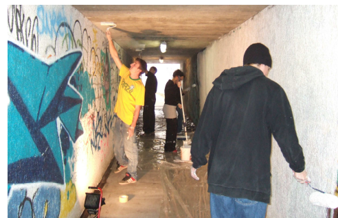
Abb. 6: Das Graffiti-Projekt

Da die Jugendlichen, die sich beim Rüteli treffen, im Alter zwischen 16 und 22 sind, konnte auch vermehrt ein Zugang zu älteren Jugendlichen aus Horw hergestellt werden. Es entstanden neue und wertvolle Kontakte zu Jugendlichen, die bis heute das Angebot des BfJ wieder aktiv für sich nutzen. So blieb es denn auch nicht nur bei Gesprächen: Im Herbst wurde beispielsweise ein gemeinsamer Graffiti-Workshop durchgeführt.