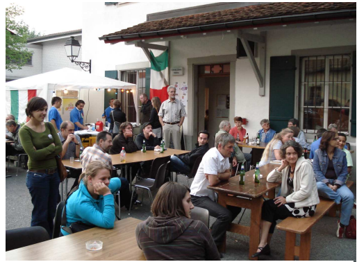
Abb. 3: Kultur(st)reich in der Papiermühle

Auch in diesem Jahr erfreuten die Räumlichkeiten der Papiermühle eine grosse Anzahl HorwerInnen. Aufgrund der steigenden Nachfrage betreffend Raumvermietungen, gehört die Verwaltung und der Unterhalt der Räumlichkeiten zu einem mittlerweile aufwendigen Dossier. Um dieser Nachfrage gerecht zu werden, hat das BfJ die ganze Administration des Vermietungswesens elektronisch erfasst und wickelt nun seit Dezember 2008 die Vermietungen über den Outlook-Kalender ab. Dies ermöglicht dem gesamten Team einen besseren Überblick und unterstützt die Verantwortlichen bei der Koordination der Fremd- und Eigenveranstaltungen. Im Jahr 2008 fanden im Jugend- und Kulturtreff Papiermühle wiederum an 168 Tagen Fremd- und Eigenveranstaltungen statt: