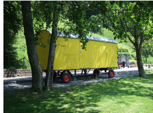
Abb. 5: Der Bauwagen im Rüteli

Das Projekt Rüteli startete Mitte April 2008 zum dritten Mal. Während dieser Rüteli-Saison arbeitete man aktiv mit einer Betriebsgruppe, welche durch das BfJ begleitet wurde. An den warmen und weniger warmen Abenden des Sommers, trafen die Jugendlichen sich mit ihren Kolleginnen/Kollegen beim Bade- und Naherholungsplatz. Die Anzahl von Jugendlichen variierte je nach Abend. Im Schnitt waren es 10 bis 30 Jugendliche. Dieses Jahr initiierte das BfJ keine konkreten Aktionen, denn solche Aufgaben übernahmen die Jugendlichen aus der Betriebsgruppe teils spontan. So fand z. B. eine grosse Geburtstags-Grill-Party statt, an welcher bis zu 40 Leute (inkl. Verwandte, Eltern und Geschwister) anwesend waren.