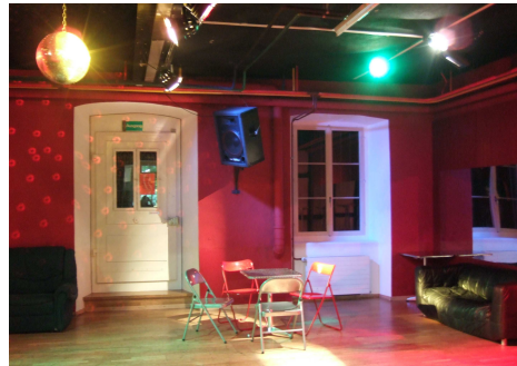
Abb. 11: Der neu gestaltete Jugendtreff

In den letzten Jahren hat sich das BfJ zu einer von Jugendlichen sehr geschätzten, von Erwachsenen breit akzeptierten und über die Gemeinde hinaus viel beachteten Institution entwickelt. Dies war nur möglich weil dem BfJ von Seite des Gemeinderates und der Verwaltung immer wieder das Vertrauen geschenkt und Fachlichkeit zugesprochen wurde. Einiges konnte sich in den letzten Jahren etablieren, Neues wurde kreiert, Anderes wiederum verworfen oder neu aufgegleist. So wird das Konzept des Jugend - und Kulturtreffs laufend angepasst und inzwischen von einer breiten Zielgruppe genutzt.