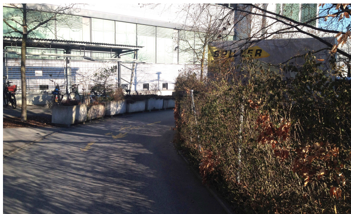
Foto 1 , Seite Kriens: Sichtbeeinträchtigung durch Hecke Grundstück Firma Spiller