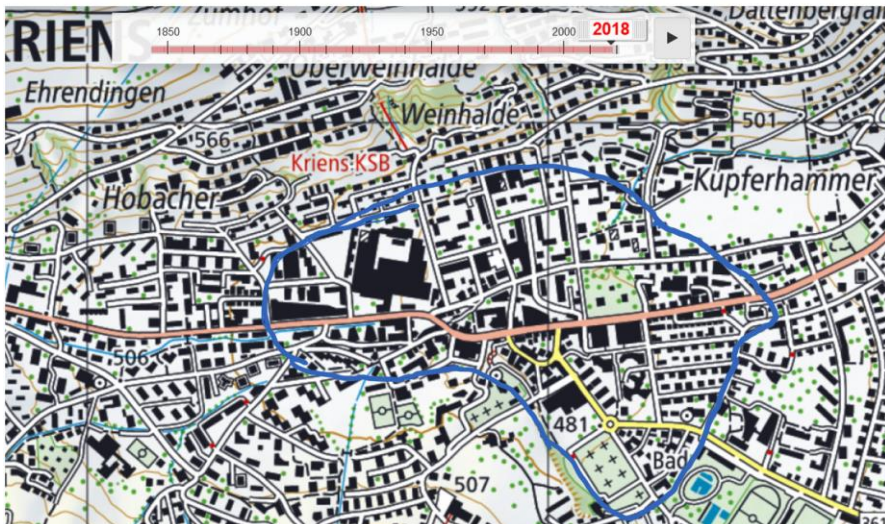
Abb 1: Zeitreise gemäss Landestopografie

https://map.geo.admin.ch/?topic=swisstopo&zoom=6.664272753212458&lang=de&bgLayer=ch.swisstopo.pixelkarte-farbe&catalogNodes=1392&layers=ch.swisstopo.zeitreihen&time=1997&layers_timestamp=19971231&E=2662964.78&N=1209768.42