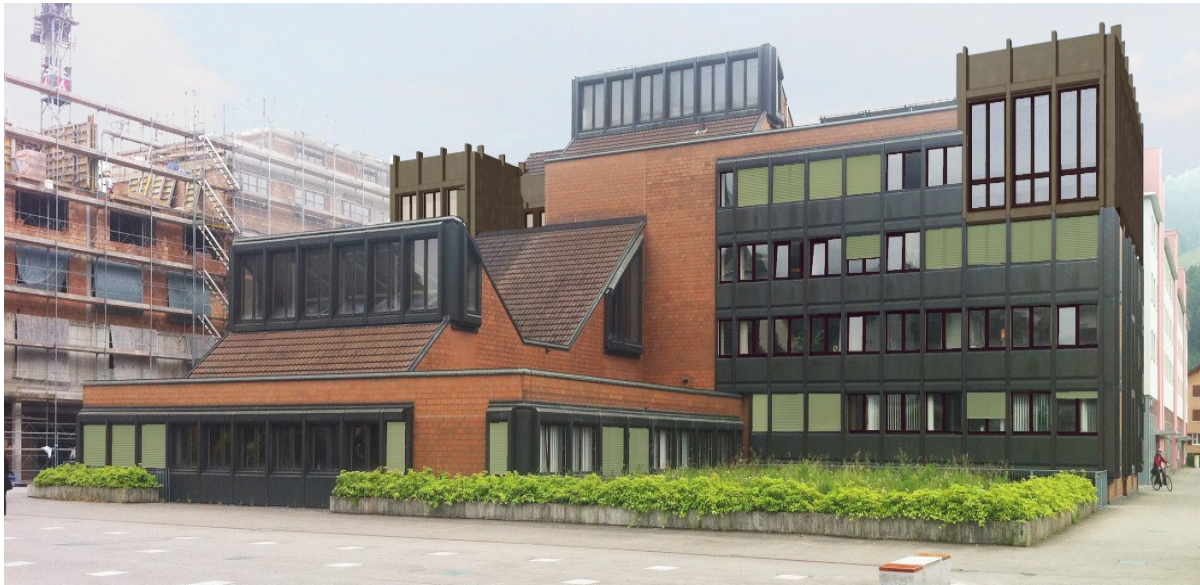
Visualisierung Gemeindehaus mit Aufstockung Süd- und Nordseite