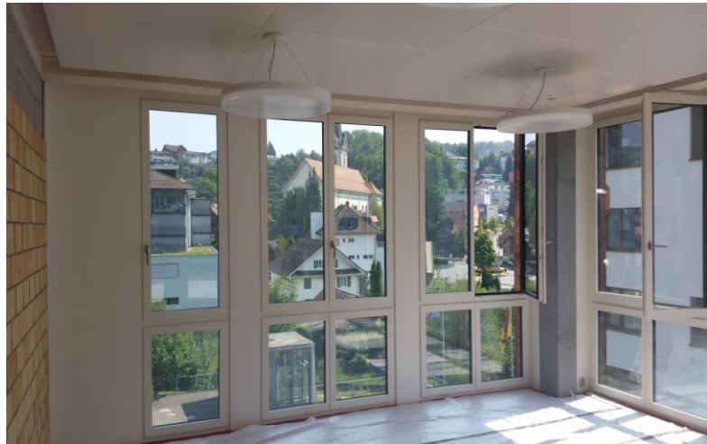
Aufstockung 4. Stock