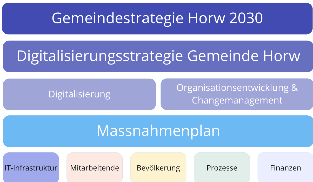
Abbildung 3: Aufbau und Wirkungsbereich der Digitalisierungsstrategie

Die untenstehende Abbildung zeigt auf, wie die Digitalisierung auf die fünf Handlungsfelder IT-Infrastruktur, Mitarbeitende, Bevölkerung, Prozesse und Finanzen wirkt.