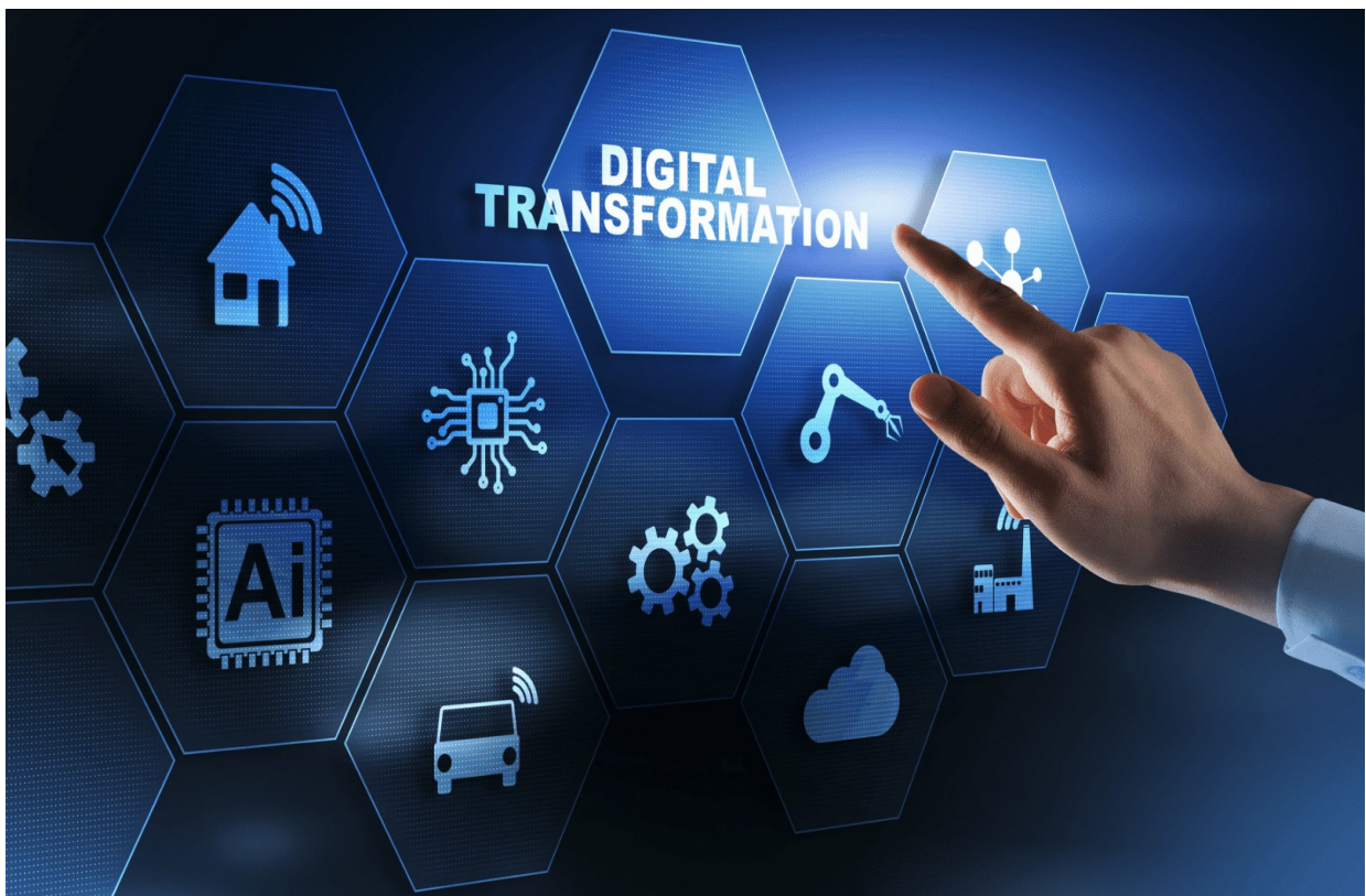
Abbildung 1: Digital Transformation