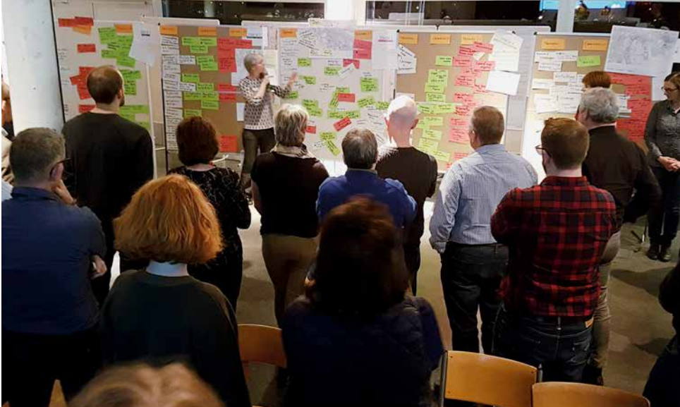
Teilnehmerinnen und Teilnehmer des Workshops zur sozialräumlichen Entwicklung von LuzernSüd.