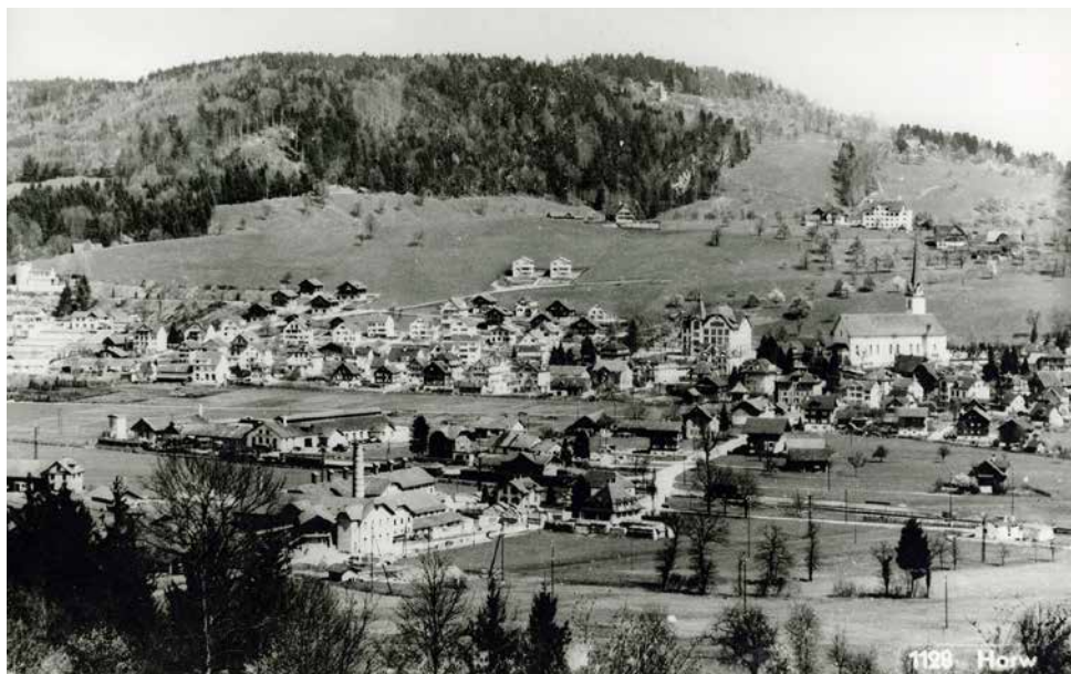
Im Jahr 1940 sind rund um den Bahnhof bereits verschiedene Gebäude vorhanden. Im Vordergrund die Ziegelfabrik Horw, welche sich in dieser Zeit zur wichtigsten Fabrik dieser Branche im Kanton entwickelt hatte. Das Rohmaterial wurde mit einer 1100 Meter langen Transport-Seilbahn zum Werkgelände beim Bahnhof geführt.