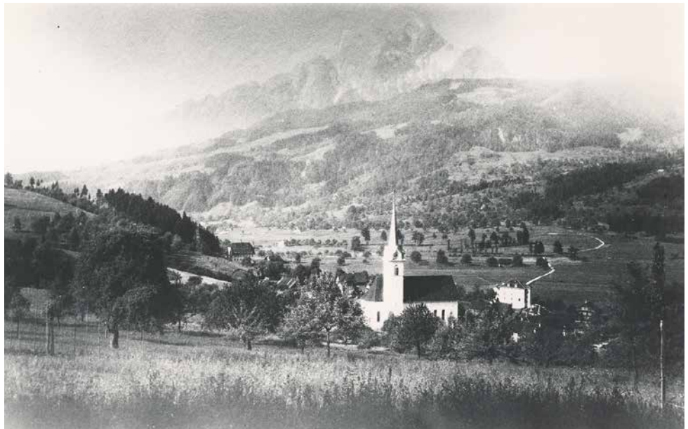
Die älteste Aufnahme von Horw stammt aus dem Jahr 1885. Neben der Pfarrkirche – hier noch in der ursprünglichen Grösse – ist rechts das alte Schul- und Gemeindehaus zu erkennen, links im Hintergrund die Papiermühle. Der zentrale Talboden ist praktisch unbebaut.

Die Bilder aus dem Gemeindearchiv zeigen die Entwicklung dieses Gebiets im Verlauf der letzten 133 Jahre.