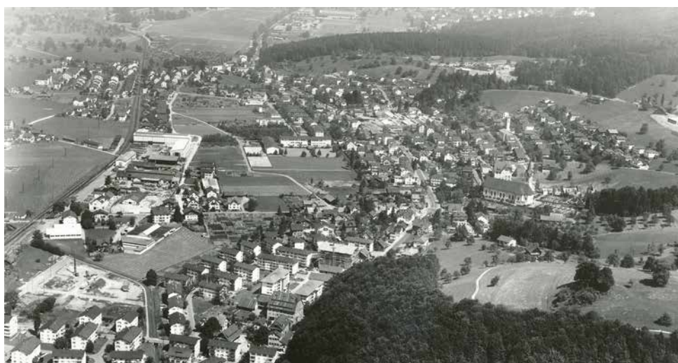
Diese Luftaufnahme der Swissair zeigt die Besiedlung von 1964. Die Fabrikationshallen der Dytan AG sind gut zwischen Allmendstrasse und Bahnlinie zu erkennen. Der 1954 als «Stahl- und Maschinenbau AG» gegründete Betrieb war in dieser Zeit der grösste private Arbeitgeber in Horw.