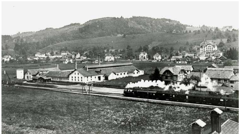
Diese bekannte Aufnahme aus dem Jahr 1910 zeigt im Vordergrund links die Glashütte der Gebrüder Siegart. Hier wurden vor allem Flaschen und Glasbriketts produziert.

Vielleicht haben auch Sie noch Fotos oder andere Dokumente aus der Horwer Vergangenheit.