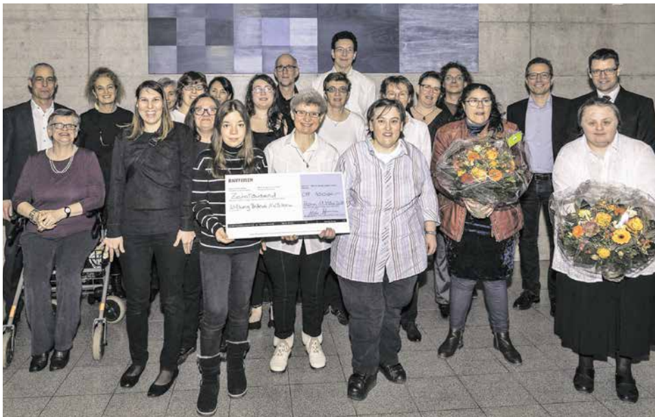
Die Brändi Singers nahmen gemeinsam mit Vertretern der Stiftung Brändi AWB Horw den Check der Raiffeisenbank Horw entgegen.

Horw, 11. März 2018. Die Raiffeisenbank Horw unterstützt auch in diesem Jahr eine soziale Institution: Die Stiftung Brändi erhält den Raiffeisen-Förderpreis in der Höhe von CHF 10'000. Die Preisverleihung fand am 11. März anlässlich der Generalversammlung statt.