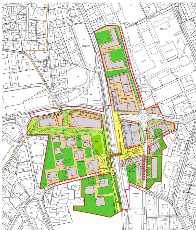
Abb. Bebauungsplan Zentrumszone Bahnhof Horw: Situationsplan vom 27.11.2012

Der Bebauungsplanperimeter weist eine Fläche von rund 12 ha auf.