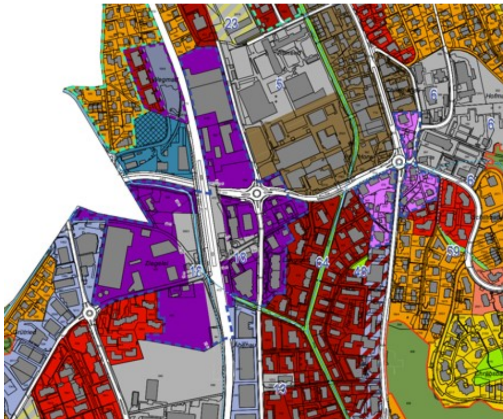
Abb. Ausschnitt aus dem rechtsgültigen Zonenplan der Gemeinde Horw

Das Bebauungsplanungsgebiet befindet sich in der «Zentrumszone Bahnhof» und in der «Zone für öffentliche Zwecke». Zudem ist das Planungsgebiet mit einer Bebauungsplanpflicht überlagert.