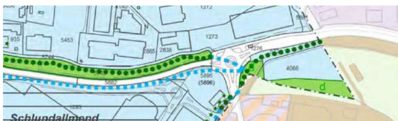
Abb. Ausschnitt aus dem rechtsgültigen Zonenplan der Stadt Kriens