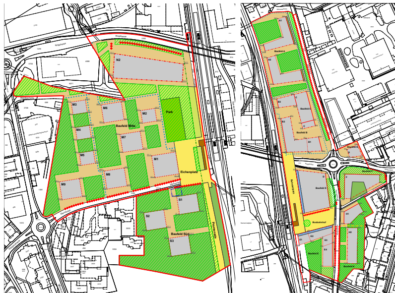
Abb. Bebauungsplan «Zentrumszone Bahnhof Horw» nach erfolgter Änderung, Teil West (ohne Teilgebiet Kriens) und Teil Ost, vom 12.08.21

Koordiniert mit der Entlassung des Teilgebiets Kriens aus dem Bebauungsplanperimeter beabsichtigt der Gemeinderat Horw, den restlichen Bebauungsplanperimeter in zwei Bebauungspläne östlich und westlich der Bahnlinie aufzuteilen. Diese rein formelle Aufteilung erfolgt ohne substanzielle inhaltliche Anpassungen.