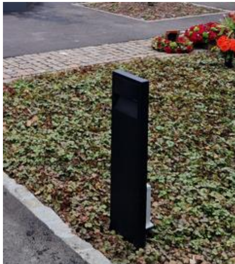
Abbildung 4: Beleuchtung