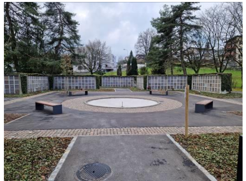
Abbildung 11: Etappe 3 Urnenhof nach Sanierung