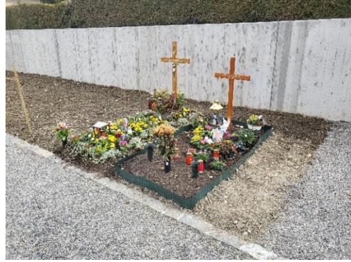
Abbildung 7: Etappe 1 nach Sanierung