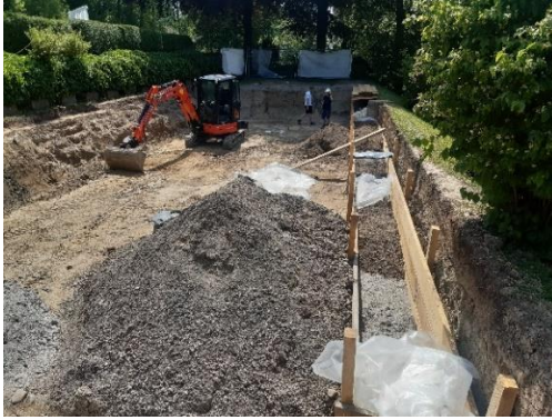
Abbildung 6: Etappe 1 während Sanierung