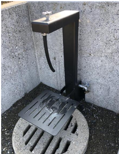
Abbildung 3: Wasserstelle

Durch die schlechte Verwesung der alten Erdreihengräber kam es zu mehr Exhumationen als erwartet, die Überreste mussten dann in einer speziell geschaffenen Gruft wieder bestattet werden. Ebenfalls mussten die Stützmauer und ein Teil der Treppen ersetzt werden und die ersten Leitungen für die neue dezente Beleuchtung wurden verlegt. Weiter wurden in jeder Etappe die Wasserstellen ersetzt.