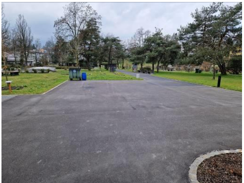
Abbildung 10: Etappe 3 Weganlage nach Sanierung