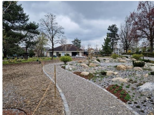
Abbildung 9: Etappe 2 nach Sanierung