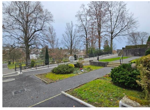
Abbildung 13: Etappe 4 nach Sanierung