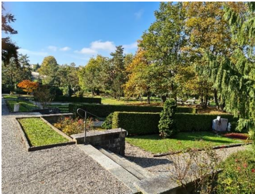
Abbildung 8: Etappe 2 vor Sanierung