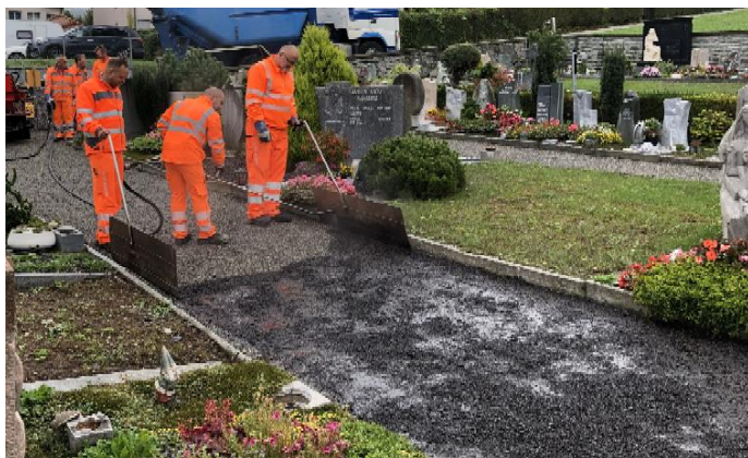
Abbildung 5: Beispiel Einbau Schottertränke

In der zweiten Etappe wurden die neuen Themengräber (Baumbestattung und Alpinum) im zentralen Teil des Friedhofs erstellt. Dies bildet äusserlich die grösste Veränderung auf dem Friedhof Gerliswil und stärkte den Friedhof als Parkanlage, welcher so von der Bevölkerung geschätzt wird. Auch in dieser Etappe gab es mehr Exhumationen als erwartet. Der Hauptweg durch den Friedhof wurde in der Etappe ebenfalls saniert und in der 3. Etappe mit einer Schottertränke versehen. Dabei wird der Kiesweg mit einer speziellen Bitumenmischung verstärkt, wobei er jedoch versickerungsfähig bleibt.