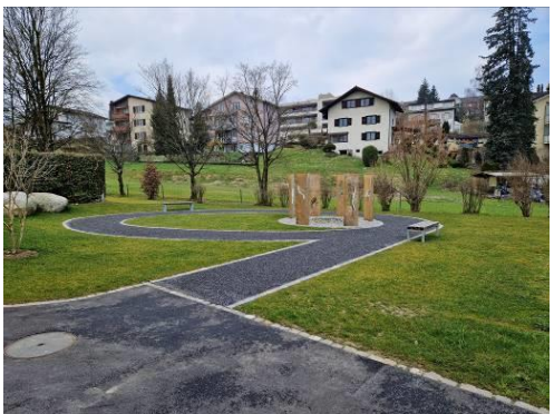
Abbildung 12: Etappe 4 neuer Kinderfriedhof